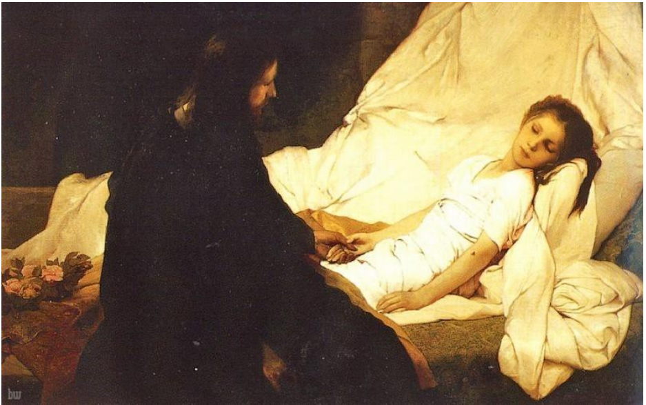
Gabriel von Max